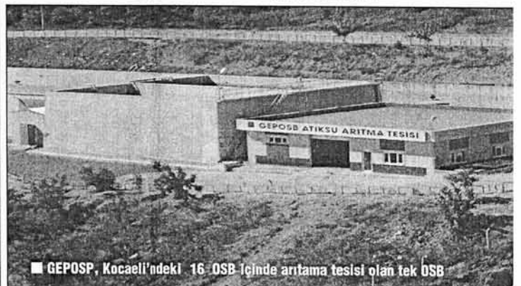
■ GEPOSB, Kocaeli'deki 16 OSB içinde arıtma tesisi olan tek OSB