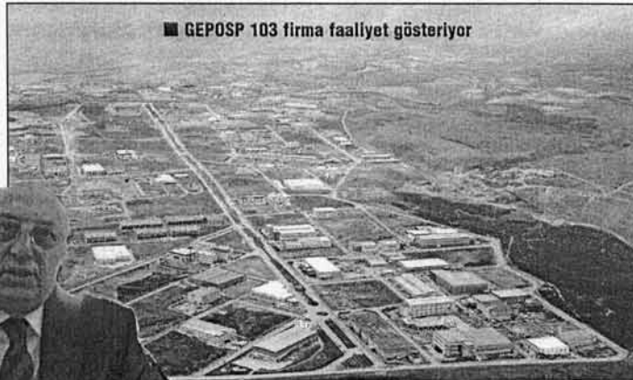
■ GEPOSB 103 firma faaliyet gösteriyor

ERKAN: Gebze Plastikçiler Organize Sanayi Bölgesi 120 hektar arazi üzerinde plastik sektörünün güçlü ve dinamik yapı-lı firmaları tarafından sektörel gereksinimi-ne çağdaş yanıtlar veren bir tasarımla kurulmuş olup sanayicilerimizin güç birliği sayesinde hayata geçirilmiştir. Üyelerimiz o dönemlerde İstanbul'un değişik semtlerinde dağınık bir şekilde faaliyetlerini sürdürmekte idiler. Bireysel düzeyde kalarak enerji darboğazı, yangın tehlikesi, sosyal örgütlenme, kaliteli iş gücü, teknolojik gelişme vs. gibi somut sorunlara çözüm üretmekte güçlük çekiliyordu. Ortak paydaları plastik olan sanayicileri bir çatı altında toplayarak sinerji yaratmak bu sinerjinin getireceği faydaları üyelere sunmak, sektörümüzün belirli merkezlerde toplanarak götürülecek hizmetleri daha ekonomik ve